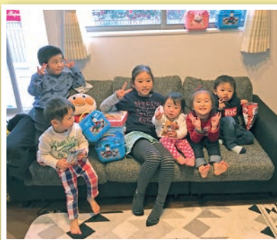
② お友達とクリスマスパーティー