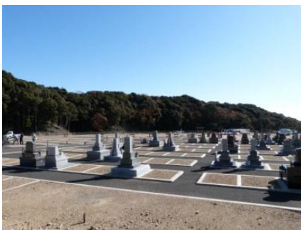
1 区画 : 31 万円～