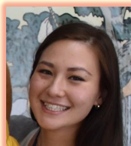
ハズミ (オーストラリア出身)