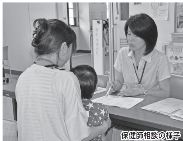
保健師相談の様子

☆相談・健診日以外でも、心配なことがありましたら、袋井保健センター・浅羽保健センターまでお気軽にご相談ください。