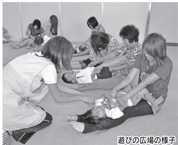
遊びの広場の様子

おさんの好きな遊びを見つけて、バリエーションを増やしましょう。おさんの楽しむ顔を見ながら、ご家庭でもお試しください。