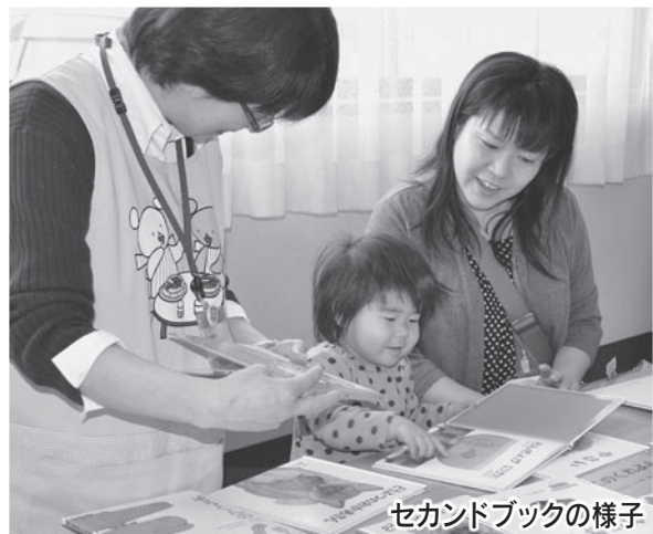
セカンドブックの様子

一方で、このころは「イヤイヤ期」とも言われる時期で、おさんの自己主張が始まるため、育児においては心配や不安も多い時期となります。