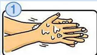
流水でよく手をぬらした後、石けんをつけ、手のひらをよくこすります。