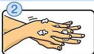
手の甲をのぼすようにこすります。