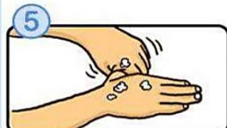
親指と手のひらをねじり洗いします。