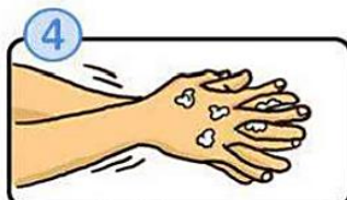
指の間を洗います。