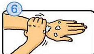
手首も忘れずに洗います。