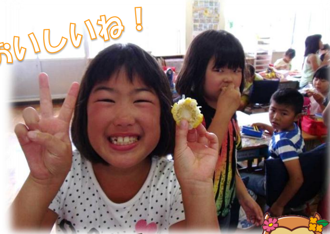
スーパーのよりおいしかったよ!