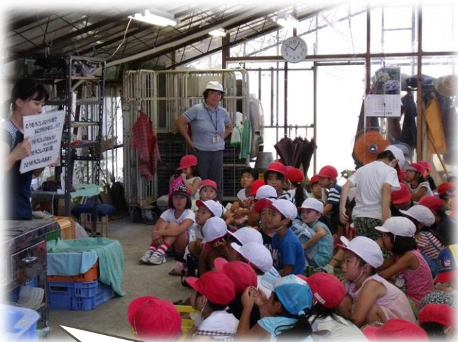
栄養教諭のお話を聞きました。