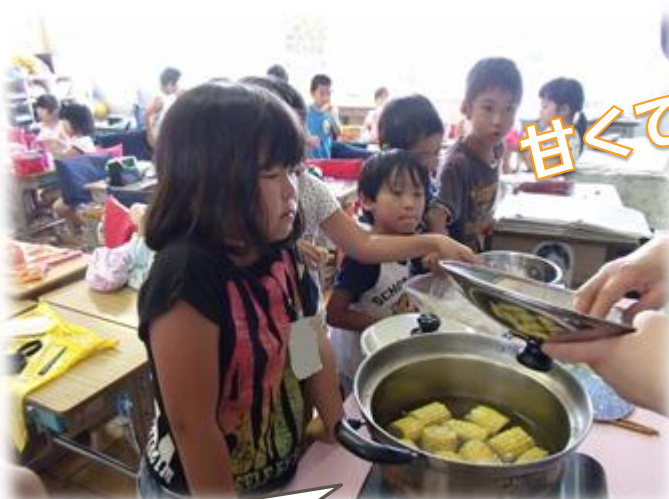
教室でとうもろこしをゆでました!