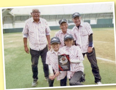
① 県民スポーツ・レクリエーション祭 ゲートボール種目で2年連続優勝！