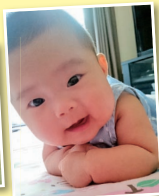
② 笑顔と喜びをありがとう！

① 楽しく仲良く試合をして いくことを心掛けていま す。是非、ゲートボール をしてみませんか？