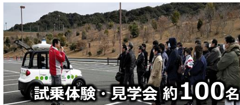
試乗体験・見学会 約100名