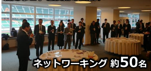
ネットワーキング 約50名