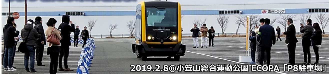
2019.2.8@小笠山総合運動公園 ECOPA「P8駐車場」