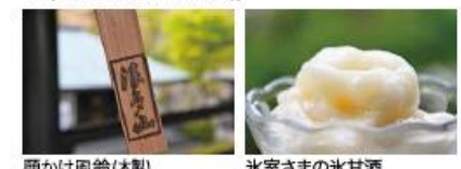
願かけ風鈴(木製) 氷室さまの氷甘酒