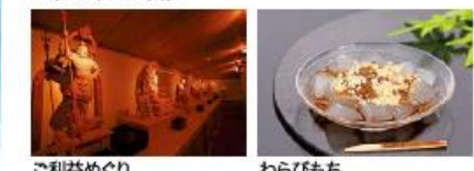
ご利益めぐり わらびもち