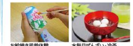
お絵描き風鈴体験 水無月ぜんざい・冷茶