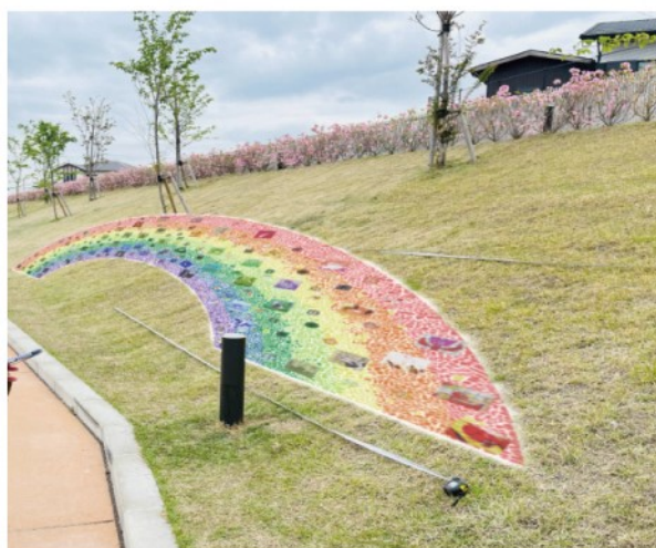
※現在進行中の作品イメージ