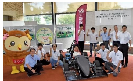
昨年度の壮行会の様子

「手足のように操れる車」をマシンコンセプトとして掲げ、瞬間移動するような軽快な加速性能、俊敏な動きを可能とする車両の低重心化と高い操舵性能、過酷な気象条件下でも耐えられる信頼性を目指して、チーム一丸となって車両製作に励んでいる。エンジン車も含めた参加全車両の総合順位で、チーム歴代最高を超える7位以上が目標。