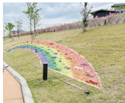
「ヒカリノミチ」作品イメージ

東京藝術大学には、平成24年度から市民を対象とした質の高い創作体験ワークショップ等を開催していた。