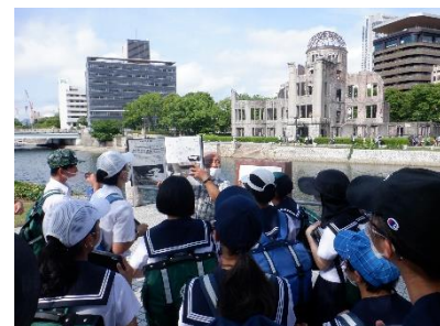
昨年度の派遣団の様子