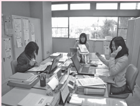
市内に4カ所ある地域包括支援センター

A 昨年度ボランティアを募集し、50名余の方に参加いただいている。現在は、イベント時のスタッフとして、また、環境整備に携わってもらっている状況である。企画段階から入っていただける方を少しずつ増やしていけるように、市民運営型のスタッフを整えている段階にある。