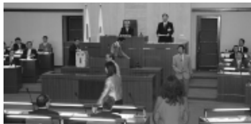
議場での投票の様子

「議会は行政と車の両輪のごとく」と言われまますように、共に諸課題に取り組み、市民の皆様にとつて住みやすいまちづくりを着実に進めることが肝要であると存じます。今後とも、市民の皆様のご指導とご協力をお願い申し上げます。