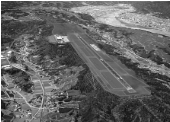
富士山静岡空港の完成予想図（平成21年3月開港予定）

答 情報交換はもとより、病院、消防、観光などの広域連携への対応のためにも貴重な場づくりになるものと考えられる。関係の市町と協議するなど検討したい。