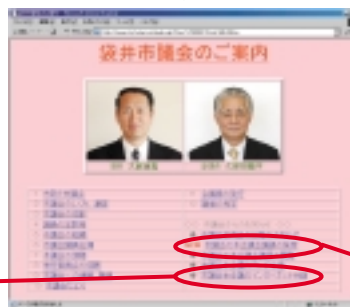
袋井市議会トップページ