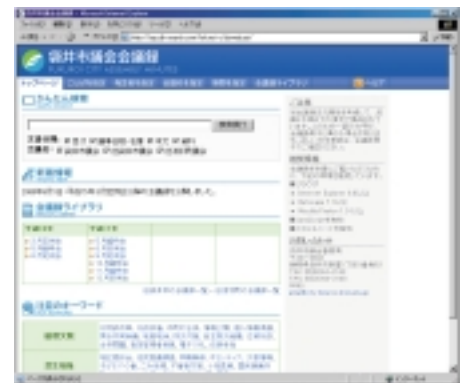
会議録検索ページ

本会議の会議録が、キーワードなどを入力することにより、見たい箇所が簡単に検索できますので、ぜひご利用ください。なお、市ホームページから会議録検索ページへの移動方法は左のとおりです。