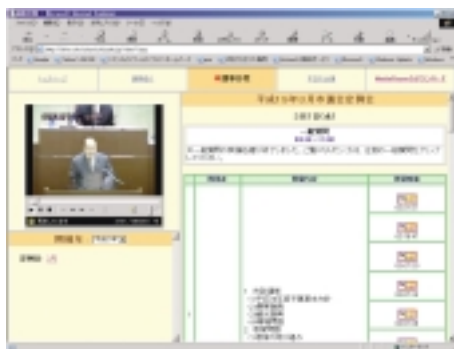
インターネット中継ページ

より開かれた市議会を目指し、定例会、臨時会の本会議ライブ中継を行っており、市議会ホームページでご覧いただけます。なお、市ホームページからインターネット中継ページへの移動方法は右のとおりです。