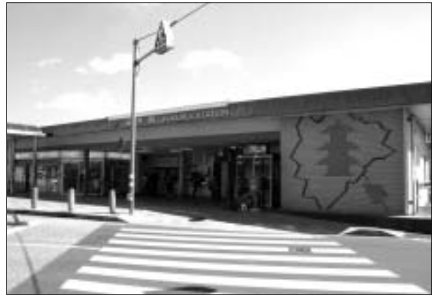
早期の工事着手が望まれるJR袋井駅舎

A 答 候補地の絞り込みが難しい状況にある。しかし墓地公園については袋井市に今必要なものであるので、21年度中には候補地を確定するための地元調整を終えて、23年度中の完成に向けて推進を図っていきたい。