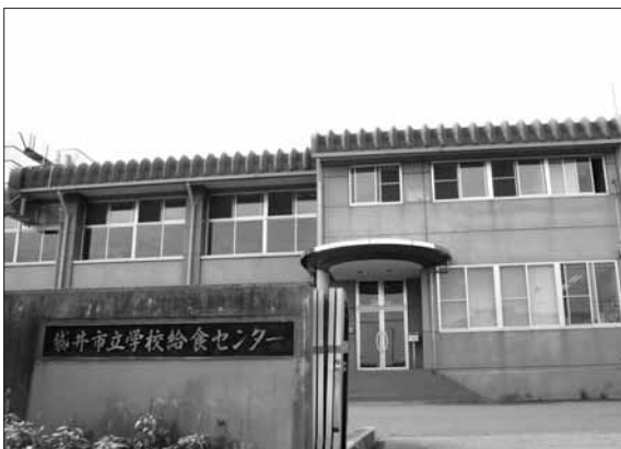
袋井市立学校給食センター

答 エピペンの使用を含めた食物アレルギーに対する研修を深め、各校・園で教職員に周知を図るなどし、万全の体制を期していきたい。