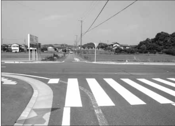
川井山梨線と下山梨山科線の交差点

答 多くの方に活動してもらうよう資格要件等を検討している。広報等を通じて保育ママの確保に努めていきたい。