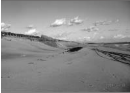
海浜公園構想のある浅羽海岸の汀線

答 道路整備10箇年計画において市の南部の幹線道路として位置づけし、平成27年度までに整備する。歩道設置要望があり、財政状況を見きわめ検討していきたい。