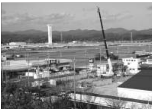
にぎわい新都心まちづくり予定地

答 検討しなければいけないと承知しているが、少し景気の状態等も見ながら、安定した段階で考えていく。