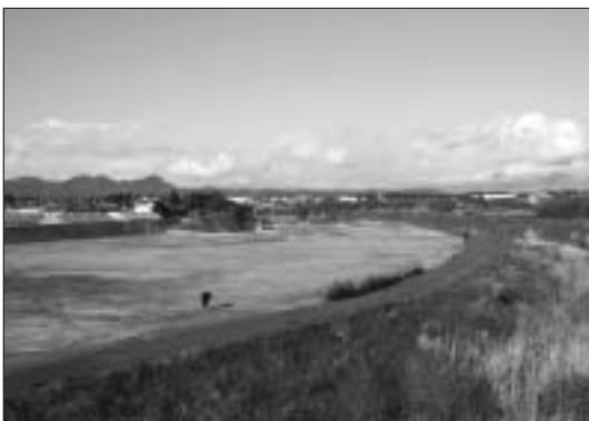
原野谷川の堤防内にあるあけぼのふれあい公園

答 遠州三山の観光については、あらかじめ各団体と協議・検討する場を設けたい。原野谷川については、新たな観光資源として活用を努めていきたい。