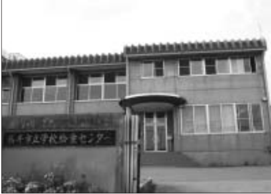
袋井学校給食センター

答 「袋井市の学校給食のあり方について」の方針に基づき、平成24年度に新給食センターによる共同調理方式に統一して市立幼稚園全てで給食を始める方針だったが、厳しい財政のため、平成25年の供用開始を目指すこととした。