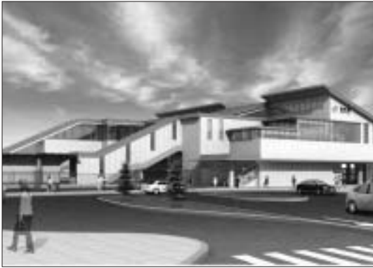
袋井駅舎完成イメージ

答 時代も変化し、動いている状況下において、どのような形式が企業にとって魅力的なものになっていくのかということに対して事務的な意味での調査研究をすぐにもしていきたい。