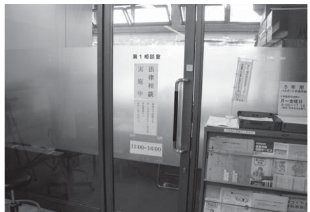
法律相談が行われる第1相談室（市役所1階）

A 敬老会の運営は自治会連合会にお願いしており、それぞれ熱心に実施していただいている。高齢者、高齢者を持つ家庭のほか、様々な関係の方に、お年寄りを敬うことが大切であるという関心が高まっていると考えており、市としても、広く市民にPRしていきたい。