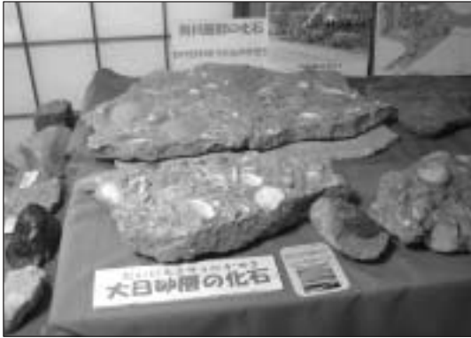
大日砂層の化石の標本

答 当市でも171施設で緊急安全点検を実施した。うち屋上へ上がることができ、かつ、進入防止措置をしていない8施設について、立入禁止看板の設置、ロープなどによる進入防止措置を行った。