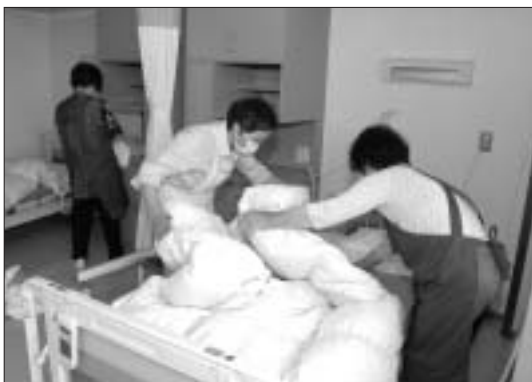
介護支援ボランティアの活動風景

答 本人が望む生活の実現に、より近くなることなどが意義として挙げられる。課題もあるが、パンフレットなどでの周知や、希望される方への説明・手続きなど支援していく。