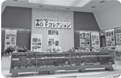
袋井市茶文化資料館

答 市のホームページや、SNSなども活用し、資料館に直接足を運ばなくても、多種多様なコレクションを鑑賞できるよう、茶文化の側面から、茶どころ袋井やふくろい茶を知るきっかけにつなげていきたい。