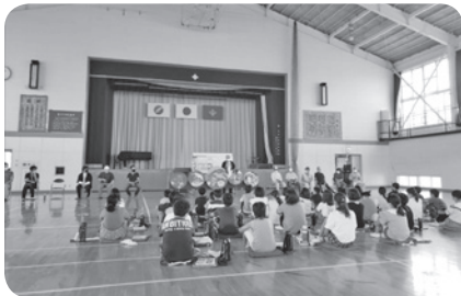
「体育座り」をする子どもの様子

答 文部科学省などからは正の通知もなく、科学的、医学的悪影響が証明されていないと考えている。児童生徒が体育座りをしている場合があるが、この姿勢を長時間維持するような指導は行っていない。