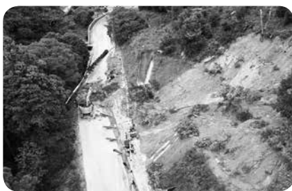
市道大谷幕ヶ谷線法面崩落の様子

答 今後、業者への長期的な委託や一体的に修繕依頼することで、経費削減にもつながると考えている。包括的民間委託などの新たな手法について、官民連携するなかで、協議検討を進め、速やかな試行に向けて努めていきたい。