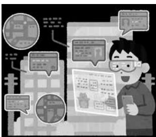
AR・拡張現実のイラスト

答 市民に体験の機会を提供するとともに、体験を通して、技術に対する市民と行政の相互理解を深めていく。そして、市民ニーズに、的確かつ効果的に応えられる具体的な施策として推進していきたいと考えている。