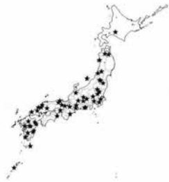
オーガニックビレッジ事業取組(予定)の状況

問 「オーガニックビレッジ構想」について基本的な考えは。 答 環境への負荷が少なく、食の安全に配慮された農作物を生産する有機農業への取組は、消費者や市場に信頼される付加価値の高い農産物の生産を推進することにつながることから、意義があるものと捉えている。