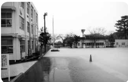
校庭貯留イメージ

答 主に森林整備と松林の再生の二つの事業を実施している。今後は、避難所などの周辺森林をはじめ、人工林の整備なども、順次実施したい。