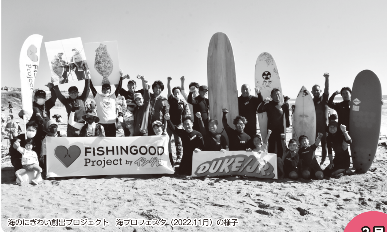
海のにぎわい創出プロジェクト 海プロフェスタ (2022.11月) の様子

※ECRS…Eliminate (排除)、Combine (結合・分離)、Rearrange (入替・代替)、Simplify (簡素化)