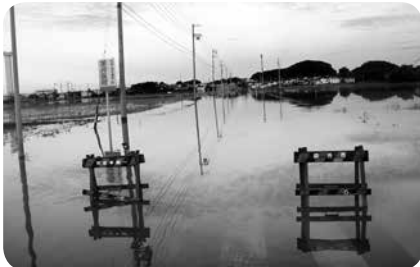
市道太郎兵衛新道国本線の冠水の様子

答 堤防のかさ上げなどは、河川の溢水を防ぐ一方で、住宅敷地内の水が排水され難くなり、被害を拡大させる可能性もある。地盤や周辺宅地の高さを確認し対策を研究していきたい。