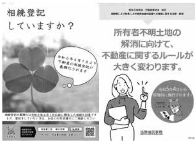
所有者不明土地及び相続登記について

問 障害者割引が行われている公共施設において、ミライロイドを確認書類として有効にしてはどうか。 答 先行して導入している各自治体の状況や個人情報管理の安全性を確認し、導入に向けて検討したい。