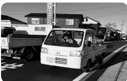
県道袋井小笠線 車両すれ違い時の様子

答 袋井南小学校では、教職員が児童に指導やボランティアの協力を得て見守りをしている。自転車マナーの向上、生徒の安全意識の向上にも努めている。関係機関と連携を図りながら安全対策を実施、子どもたちの事故防止に努めていく。