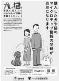
環境省「犬と猫のマイクロチップ情報登録」啓発ポスター

答 今後部活などの地域スポーツクラブなどに移行される際、民間の団体への活動支援についても、部活の地域移行とあわせ、検討していく。