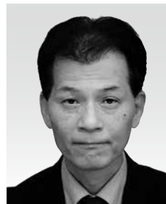
大河原幸夫 副市長

【任期】 令和5年2月24日～ 令和9年2月23日（4年間） （元袋井市理事兼企画部長）