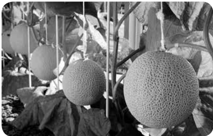
静岡クラウンメロン

答 県の制度内容を確認するとともに、市内生産者への周知を行い、申請内容や状況を見極め、ニーズを把握しながら、市独自の助成制度を検討していく。