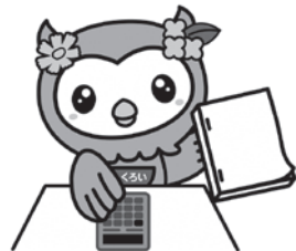
働き方、処遇、労働環境

答 今後年齢枠を広げて、チャレンジできる仕組みに変えたい。社会人経験を行う政運営に生かせる人材の採用を検討している。男女差なくそれぞれの希望する働き方、仕事、報酬が報われる社会が来ることを強く願い、理想的な状況ができるよう努めていきたい。