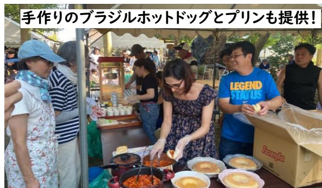
手作りのブラジルホットドッグとプリンも提供！