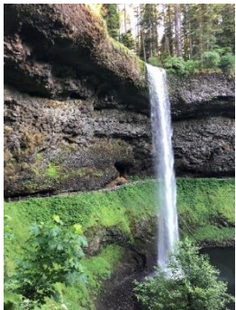
シルバー クリーク滝

また、夏はバーベキューの時期です。アメリカの各地方はそれぞれの味や焼き方、スタイルがありますが、アメリカ南部のバーベキューが一番有名です。バーベキューのソースは甘さ、酸っぱさ、そしてスモーキーな味が同時にします。鶏肉、牛肉や豚肉など、どれもこのソースをつけて食べます。機会があれば、皆さんもぜひアメリカン・サマーを楽しんでみてくださいね！