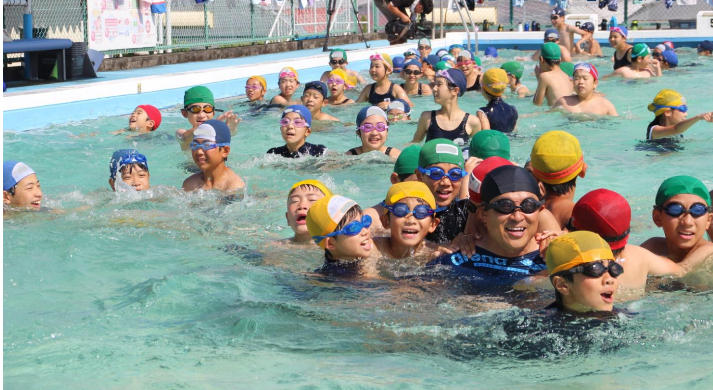
【全校児童がプールで最後の思い出作り】