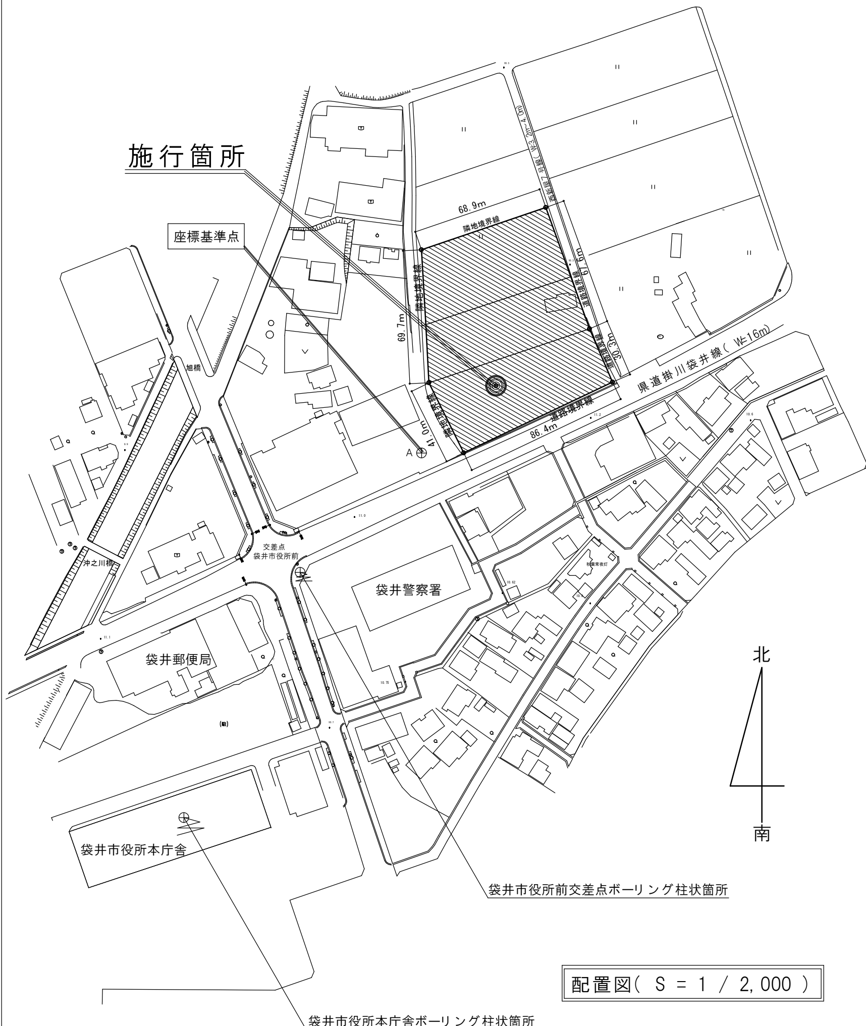
配置図( S = 1 / 2,000 )