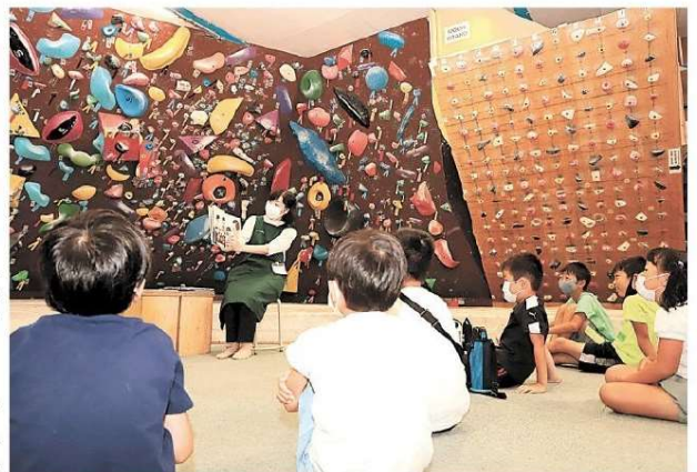
ボルダリング施設で行われた絵本の読み聞かせ ＝袋井市内