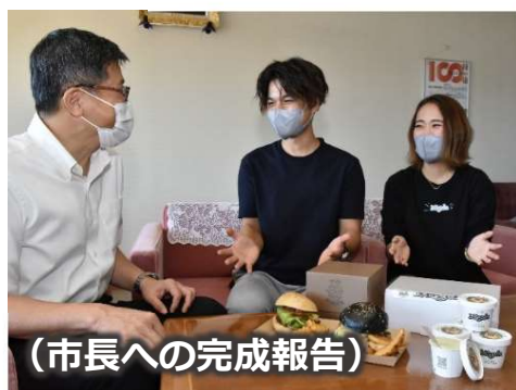
(市長への完成報告)