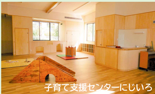
子育て支援センターにじいろ

子育て中の母親の孤独感や育児不安の軽減が図れるように支援員が相談や助言を行うほか、親子同士が気軽に交流し、情報交換ができる場を提供する支援事業。市内には、子育て支援センターが7施設ある。