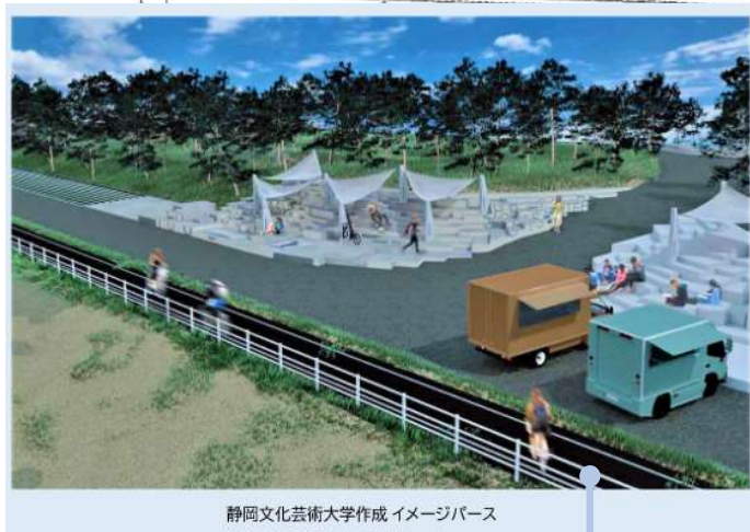
静岡文化芸術大学作成 イメージパース