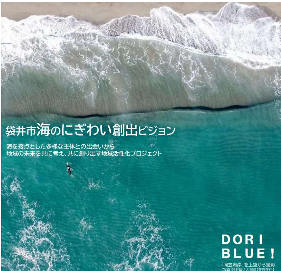
同笠エリアの完成イメージ図

海を接点とした多様な主体との出会いから 地域の未来を共に考え、共に創り出す地域活性化プロジェクト