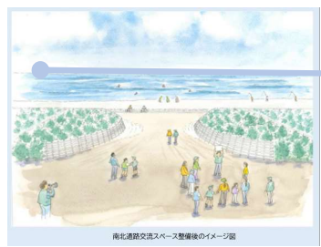
南北道路交流スペース整備後のイメージ図