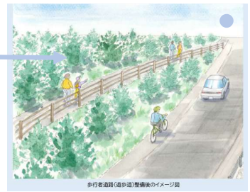
歩行者道(遊歩道)整備後のイメージ図