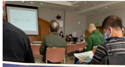
地エリア原観計画 月海岸 (呉丹志)

ビジョンの策定を受け、基本計画(素案)や今後の維持管理面での課題等について地元の住民や企業、海岸利用者らと本格稼働に向けたワークショップを開催