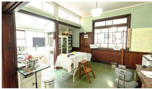
開業当時の医療器具が残る⑨診察室と⑩手術室【病棟1階】