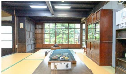
懐かしい面影を残す⑪座敷【居宅】