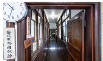
⑥待合室から⑧診察室への長い廊下【病棟1階】