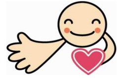
徳育シンボルマーク「ニコリン」