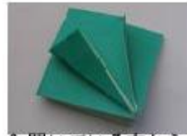
6. 開いている方から三角に折ります