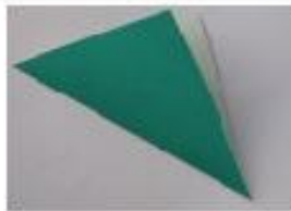
2. 斜め半分に折ります