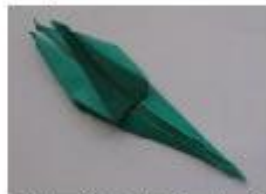
15. 首と尻尾になる部分を起こします