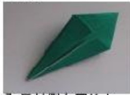
7. 反対側も同じように折ります