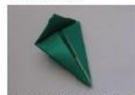
8. 上三角部に折り目をつけます