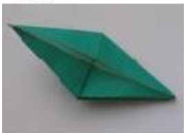
9. 広げてつぶします