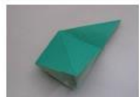
4. 三角部分を開いてつぶします