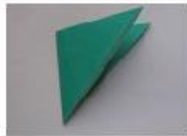
3. 更に半分に折ります。