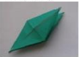
11. きれいに合せます