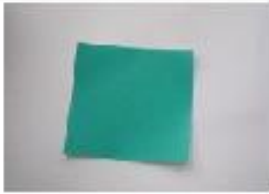
1. 折り紙を用意します