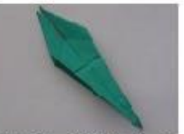
14. 重なり部分を両方とも広げます