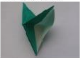
10. 反対側も広げてつぶす