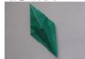
12. 開いた側から半分に折ります