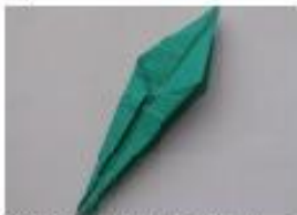
13. 反対側も折ります