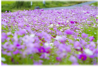
場所: 村松西公会堂付近

毎年10月に入ると袋井市内の道路脇や休耕田、公園などにコスモスが咲き始めます。秋の心地よい空気を感じながらコスモス畑へおでかけしませんか？ 【見頃】 10月中旬～10月下旬頃