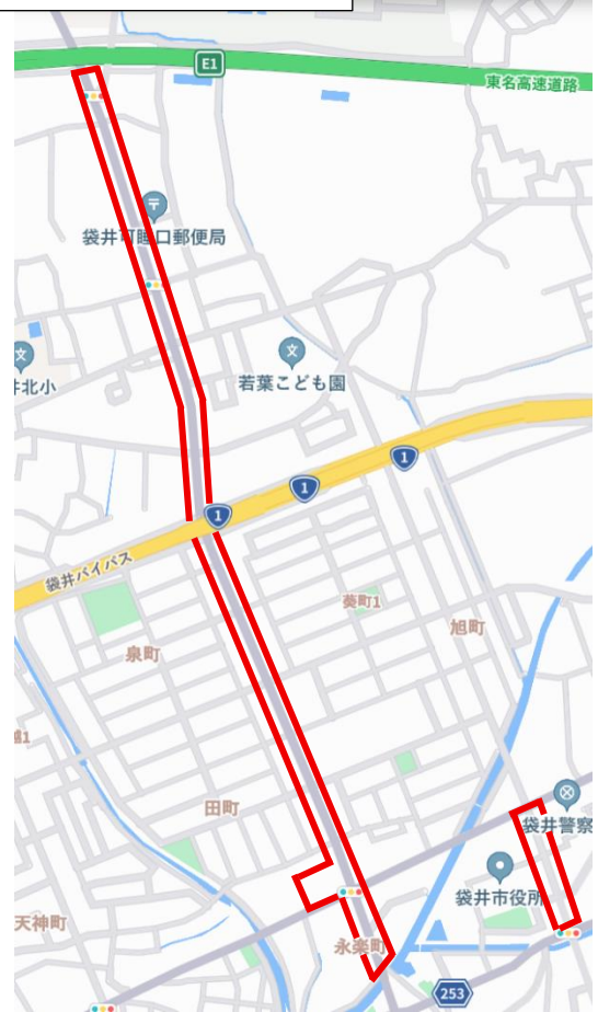
袋井春野線周辺・新屋