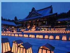
万灯祭(法多山) 7月9日(火)・10日(水)