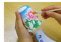
お絵描き風鈴体験