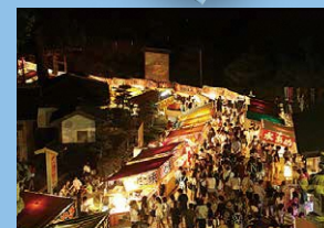
奥之院不動尊大祭(可睡齋) 8月28日(水)

行事やイベントは天候や社会状況によって開催日や内容が変更になる場合がございます。