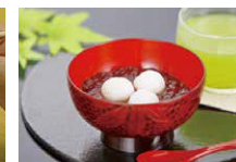
水無月ぜんざい・冷茶