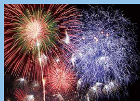
ふくろい遠州の花火(原野谷川親水公園) 7月27日(土)