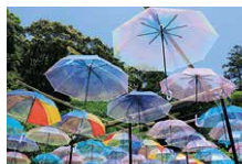
アンブレラスカイ

〒437-0061 静岡県袋井市久能 2915-1 TEL: (0538)42-2121(代)/FAX: (0538)42-1429 https://www.kasuisai.or.jp