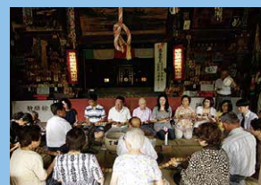
百万遍(油山寺) 8月8日(木)