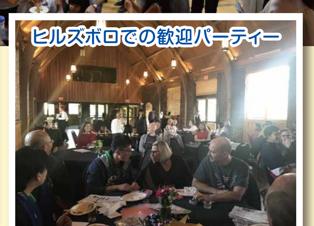
ヒルズボロでの歓迎パーティー