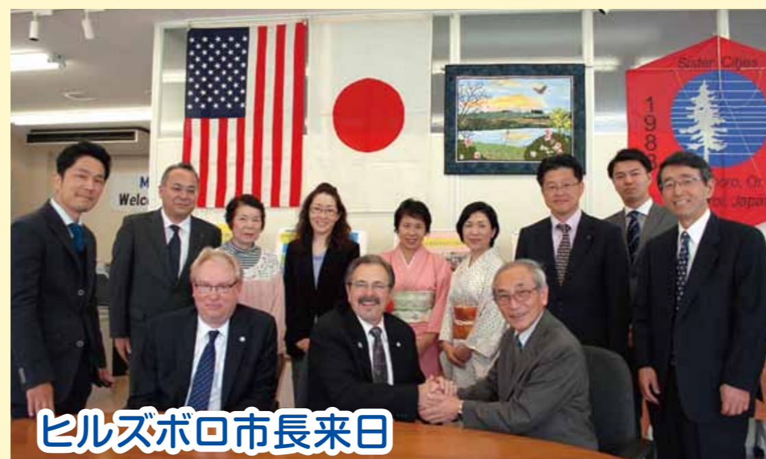
ヒルズボロ市長来日