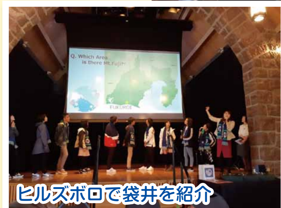
ヒルズボロで袋井を紹介