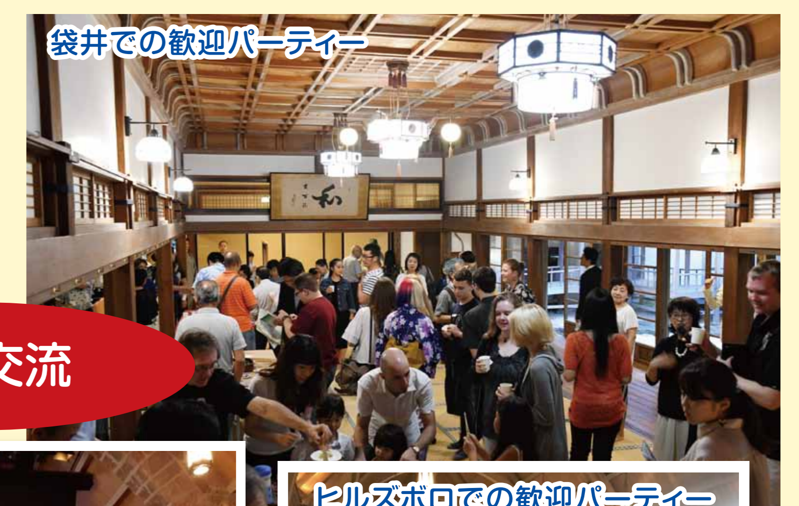
袋井での歓迎パーティー