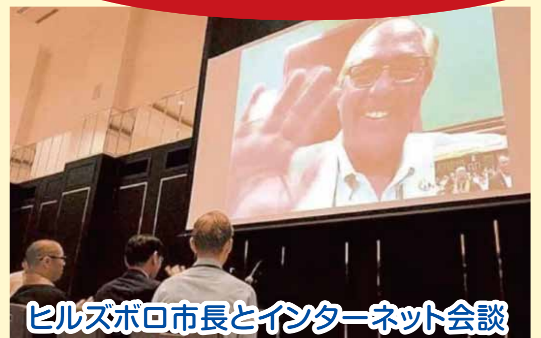
ヒルズボロ市長とインターネット会談