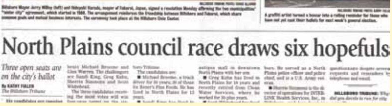
ヒルズボロにて両市長による「交流促進の確認書」の調印