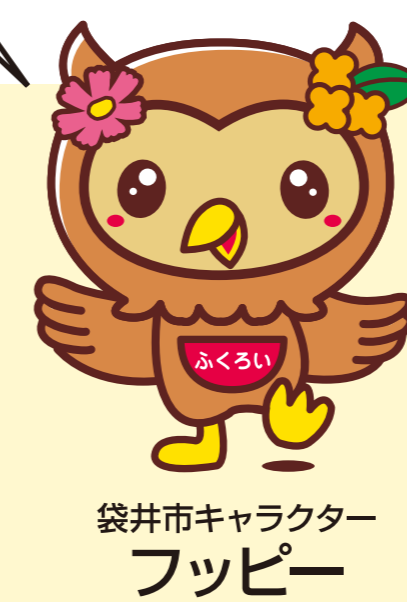
袋井市キャラクター フッピー