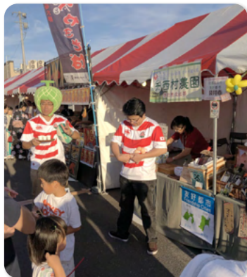
岩沼市で袋井茶の販売