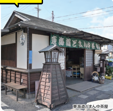
東海道どまん中茶屋

袋井市は、江戸時代には東海道五十三次のちょうどまんなか、27番目の宿場・袋井宿として栄えました。「袋井」の地名は、四方を川に囲まれた「袋」のような地形に由来するなどとも言われています。