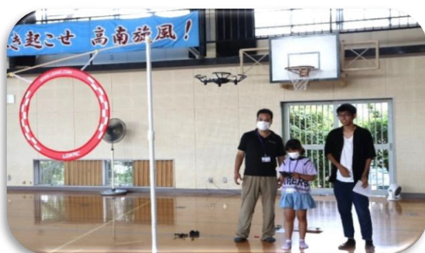
プログラミングをしてドローンをとばしたり、コントローラをそうさして、わっかを通して楽しかった。 (ドローンを飛ばそう)