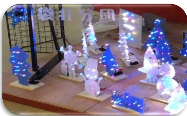
雪だるまのイルミネーションを作りました。はんだづけがうまくできてよかったです。クリスマスにかざります。 (マイイルミネーションの製作)