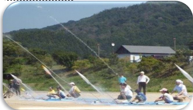
一番心に残ったのは水ロケットです。147mも飛びました。 (水ロケットの製作と試射)