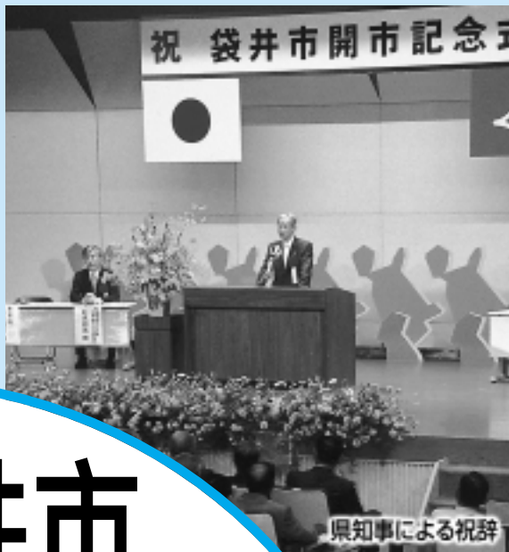
県知事による祝辞

で約500人が出席して 念式典」が開催されました。 嘉延県知事も出席。 10万羽の折り鶴や匠展、 んなで盛り上げました。 書係 ☎44-3103