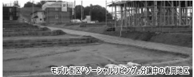
モデル街区「ソーシャルリビング」分譲中の春岡地区