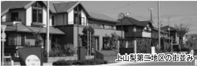
上山梨第二地区の街並み