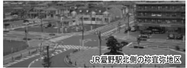
JR愛野駅北側の祢宜弥地区