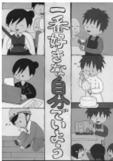
平成17年度最優秀作品

性別による固定的な役割分担にとられずに、それぞれの個性と能力を発揮できるような男女共同参画社会を表現した漫画やイラストを募集します。 応募資格 県内在住・在学・在勤の方 応募規定 自作で未発表のもの（複数出品可） 大きさはA4 技法は自由（絵の具、フェルトペン、パソコンなど） 色は自由（白黒、カラー） 応募方法 作品の裏面に郵便番号、住所、氏名（ふりがな）、年齢、性別、電話番号、作品のタイトルを記入し、持参または、郵送してください（作品は返却しません）。 募集締切 6月26日（月）