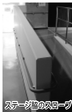
ステージ脇のスロープ

出演者控え室には、多目的トイレも設置しました。高齢者や体の不自由な方、お子さん連れの方なども利用しやすくなりました。