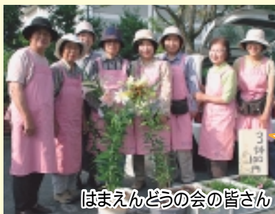
はまえんどうの会の皆さん

あさっぱら市に参加して、12年になります。「はまえんどうの会」の会員が育てた季節の花の苗を販売しています。