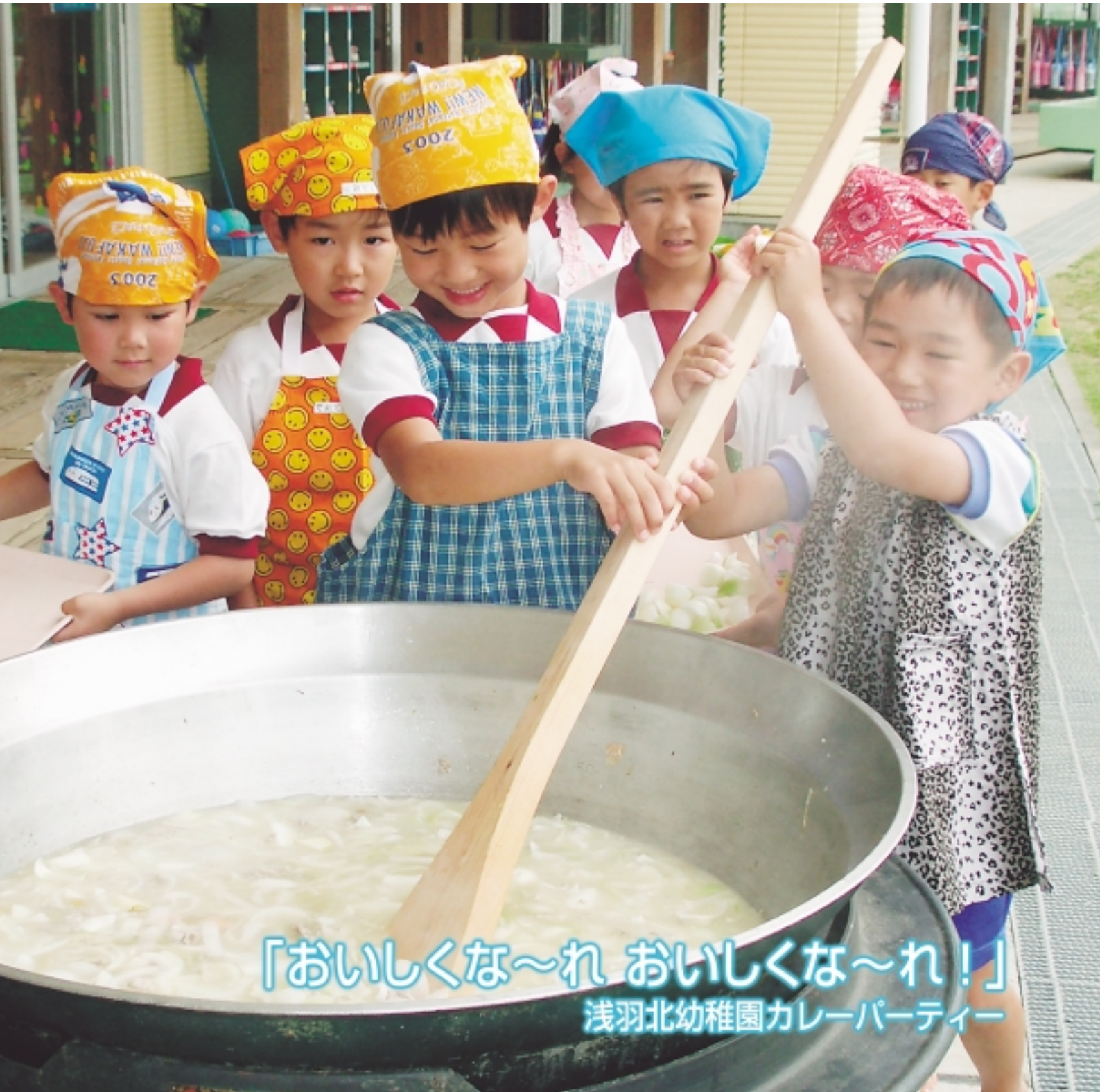
「おいしくな～れ おいしくな～れ！」 浅羽北幼稚園カレーパーティー