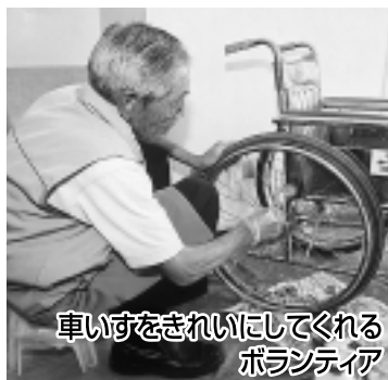
車いすをきれいにしてくれるボランティア