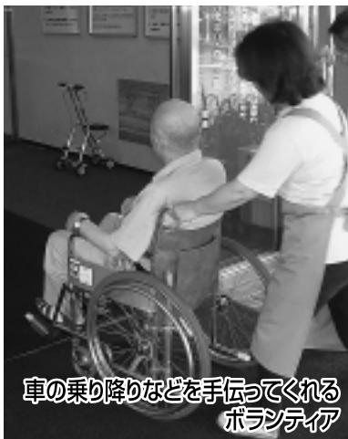
車の乗り降りなどを手伝ってくれるボランティア

そうした場合に、主治医以外の専門医に相談し、意見を聞くことで診断や治療法の妥当性が理解でき、治療の選択の幅が広がります。