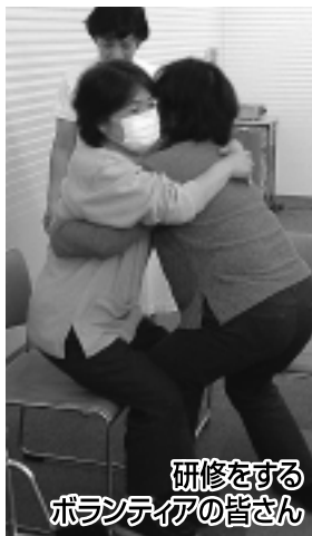
研修をするボランティアの皆さん