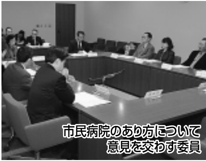
市民病院のあり方について 意見を交わす委員