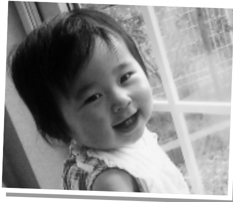
袋井に引っ越してきたよ