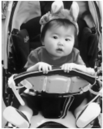
初めてのディズニーランド