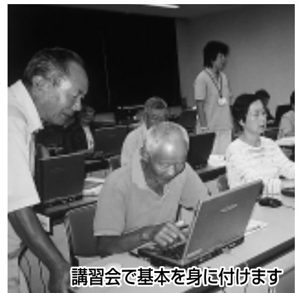
講習会で基本を身に付けます